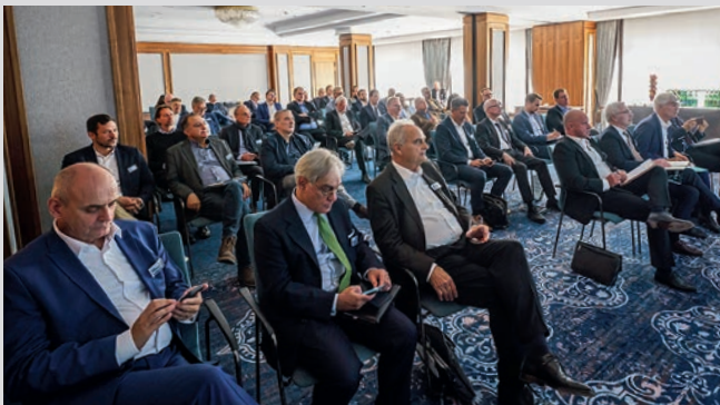
In 17 Workshops stellten Produktpartner Märkte und Anlagemöglichkeiten vor. Allerdings mussten sie sich bereit erklären, sich einer kritische Diskussion zu stellen. Da kamen auch Dinge zur Sprache, die nicht im Prospekt stehen.