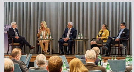
Das Podium diskutierte die Frage, ob Inflation und Zinswende den Real-Asset-Boom abwürgen. Fazit: Sachwertinvestments können Zyklen überdauern.